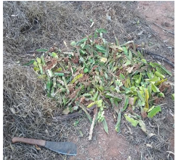
Figura 2 – Cladódios picados