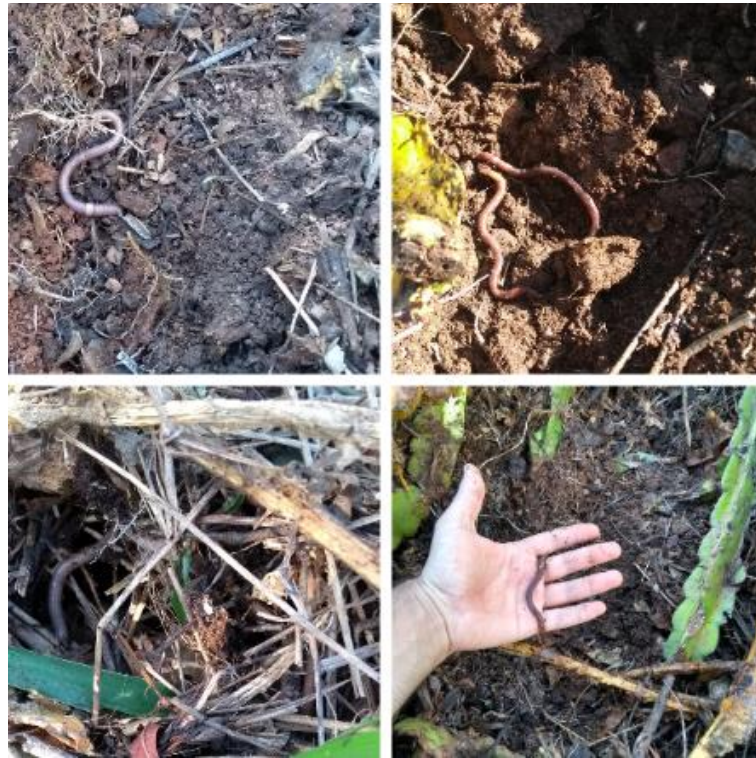
Figura 6 – Presença de minhocas em todos os tratamentos da segunda avaliação.