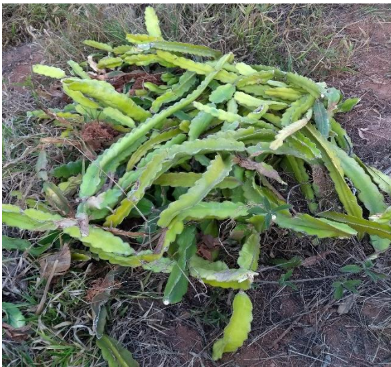
Figura 1 – Cladódios inteiros

Foram avaliados seis tratamentos diferentes: cladódios picados grosseiramente e cladódios inteiros, associados a três métodos de compostagem (Tradicional, Embrapa e Agroflorestal). O material utilizado foi oriundo da poda realizada na propriedade, tanto de pitaia branca ( Selenicereus undatus ) como também de pitaia vermelha ( Selenicereus polyrhizus ), e os cladódios que foram picados ficaram com cerca de 15 cm de comprimento, sendo esses cortes realizados com facão (figuras 1 e 2).