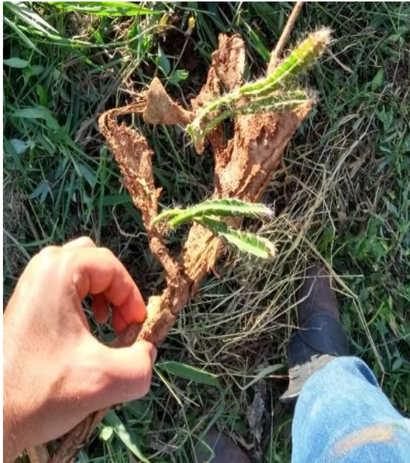
Figura 5 – Brotações de pitáia em material em decomposição no tratamento 2

Apenas nos cladódios do tratamento 2 foram observadas brotações (FIGURA 5), mesmo que o cladódio estivesse totalmente seco, as brotações estavam verdes. A pitáia apresenta esse potencial de produzir brotações de forma muito eficiente, o que pode ter dificultado o processo de compostagem.