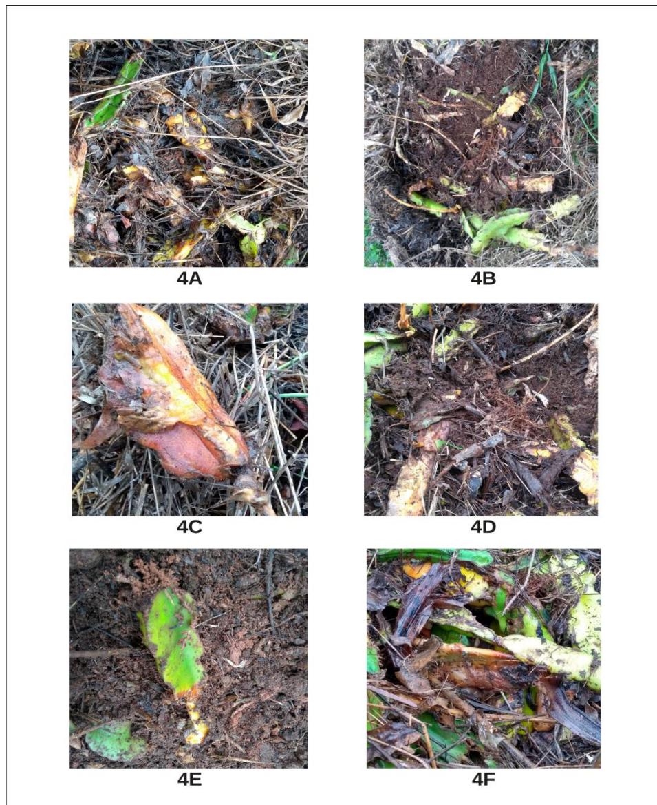
Figura 4 - Avaliação dos tratamentos em 12/2021 (4 meses após a instalação do experimento), em que a Figura 4A representa a compostagem tradicional com cladódios picados, 4B compostagem tradicional com cladódios inteiros, 4C compostagem da Embrapa com cladódios picados, 4D compostagem da Embrapa com cladódios inteiros, 4E compostagem baseada no Sistema Agroflorestal com cladódios picados e 4F compostagem baseada no Sistema Agroflorestal com cladódios inteiros.

Pode-se observar na segunda avaliação realizada em dezembro de 2021, todos os tratamentos já apresentavam um grau bem mais elevado de decomposição, sendo que os tratamentos 1 (FIGURA 4A) e 3 (FIGURA 4C) foram os que apresentaram decomposição mais avançada do material. Isso pode ser explicado devido a esses tratamentos terem sido realizados com cladódios picados, o que acelerou a decomposição. Já os tratamentos 4 (FIGURA 4D), 5 (FIGURA 4E) e 6 (FIGURA 4F) apresentaram decomposição intermediária, e o tratamento 2 (FIGURA 4B) foi o de menor decomposição. Em todos os tratamentos foi possível verificar que a decomposição era maior na parte mais interna das pilhas.