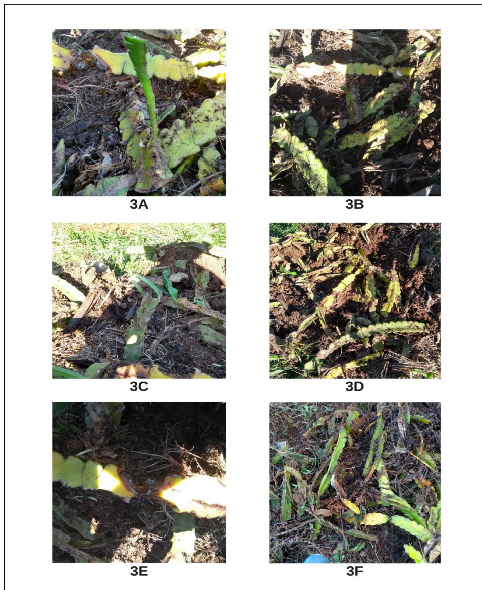
Figura 3 - Avaliação dos tratamentos em 11/2021(3 meses após a instalação do experimento), em que a Figura 3A representa a compostagem tradicional com cladódios picados, 3B compostagem tradicional com cladódios inteiros, 3C compostagem da Embrapa com cladódios picados, 3D compostagem da Embrapa com cladódios inteiros, 3E compostagem baseada no Sistema Agroflorestal com cladódios picados e 3F compostagem baseada no Sistema Agroflorestal com cladódios inteiros.

Na primeira avaliação, que foi realizada após 3 meses da instalação do experimento, ou seja, em novembro de 2021, verificou-se que os cladódios ainda estavam bem preservados e o processo de compostagem não havia iniciado de forma significativa. Contudo, os tratamentos 5 (FIGURA 3E) e 6 (FIGURA 3F) apresentaram sinais de decomposição na parte mais interna das pilhas. Foi observado também que houve alguns cladódios que apresentaram brotações, provavelmente devido a entrada de luz na pilha, visto que eram materiais que estavam superficiais, no entanto este fenômeno foi observado apenas no tratamento 1 (FIGURA 3A).