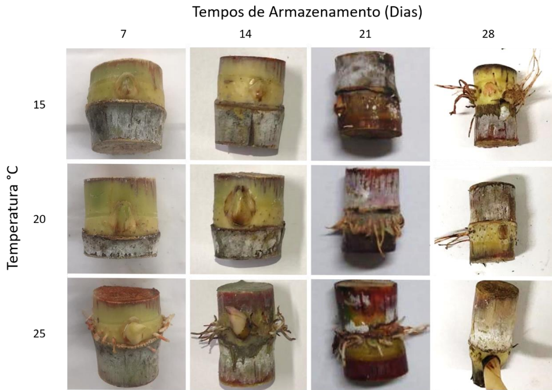
Figura 1. Aspecto visuais dos minitoletes de cana-de-açúcar armazenados sob diferentes temperaturas. Lavras, MG.

Houve interação positiva para as variáveis analisadas: perda de umidade (g), brotação (%) e índice de velocidade de emergência pelo teste de Tukey a 5% de probabilidade. Para variável perda de umidade, os minitoletes armazenados aos 7 dias tiveram redução de peso à medida que os dias foram aumentando. Já nas demais temperaturas não foi possível correlacionar a perda de peso com o tempo de armazenamento, pois ocorreram início de brotação (Tabela 1).