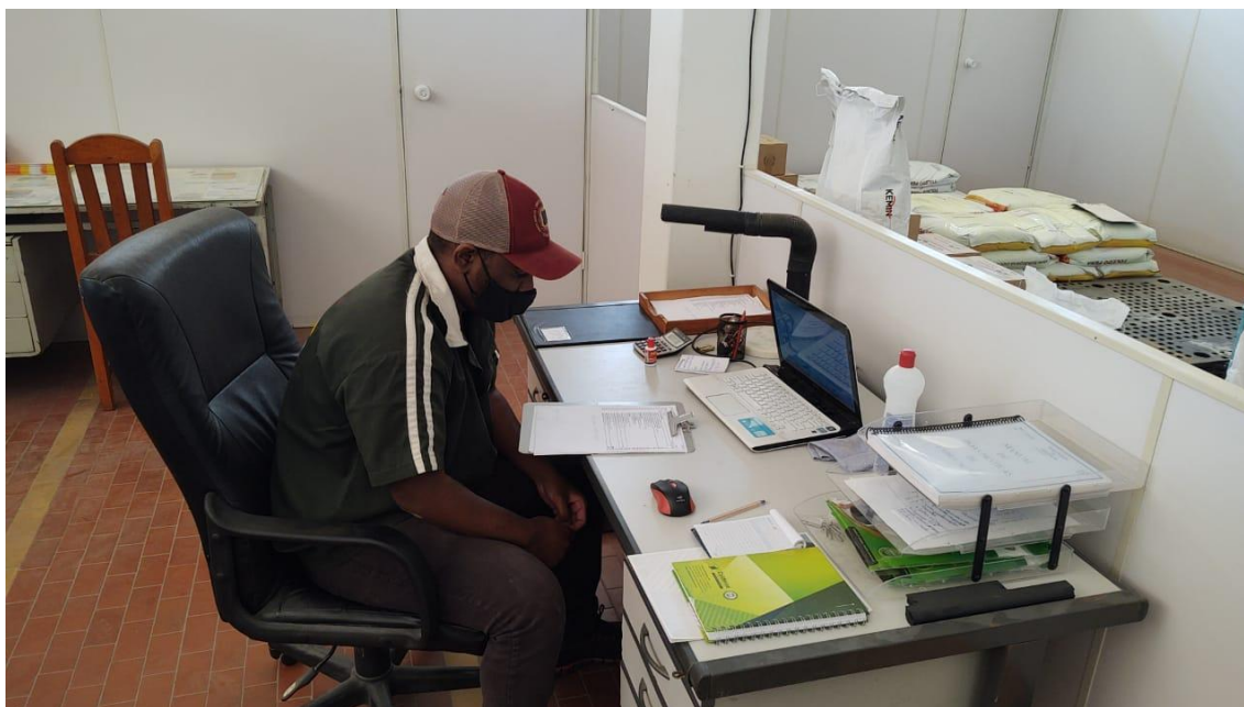
Figura 7 – Setor de controle de produção e logística da Agropecuária Toledo pena

Em geral, para cada ação realizada na empresa é gerada uma planilha que contém o número de registro do funcionário e assinatura do responsável, além de uma breve descrição do procedimento. No final de cada semana esses documentos são conferidos e armazenados. Esse controle é necessário para caso haja ocorrências na produção, elas possam ser identificadas e corrigidas rapidamente, sempre com o intuito de evitar multas e conseqüentemente à perda da autorização de produção.