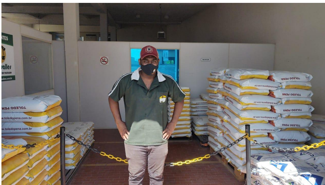
Figura 6 – Setor de vendas e atendimento aos clientes da Agropecuária Toledo Pena

A última fase são as vendas através da consultoria. A Toledo Pena além de ser uma fábrica de rações é também uma empresa técnica que presta consultoria, para isso fazem parte do corpo de funcionários da empresa, um engenheiro agrônomo e dois zootecnistas. Esse tipo de serviço em geral, é destinado a clientes que compram vários tipos de produtos diferentes e que precisam de um acompanhamento mais específico de cada fase dos seus animais.