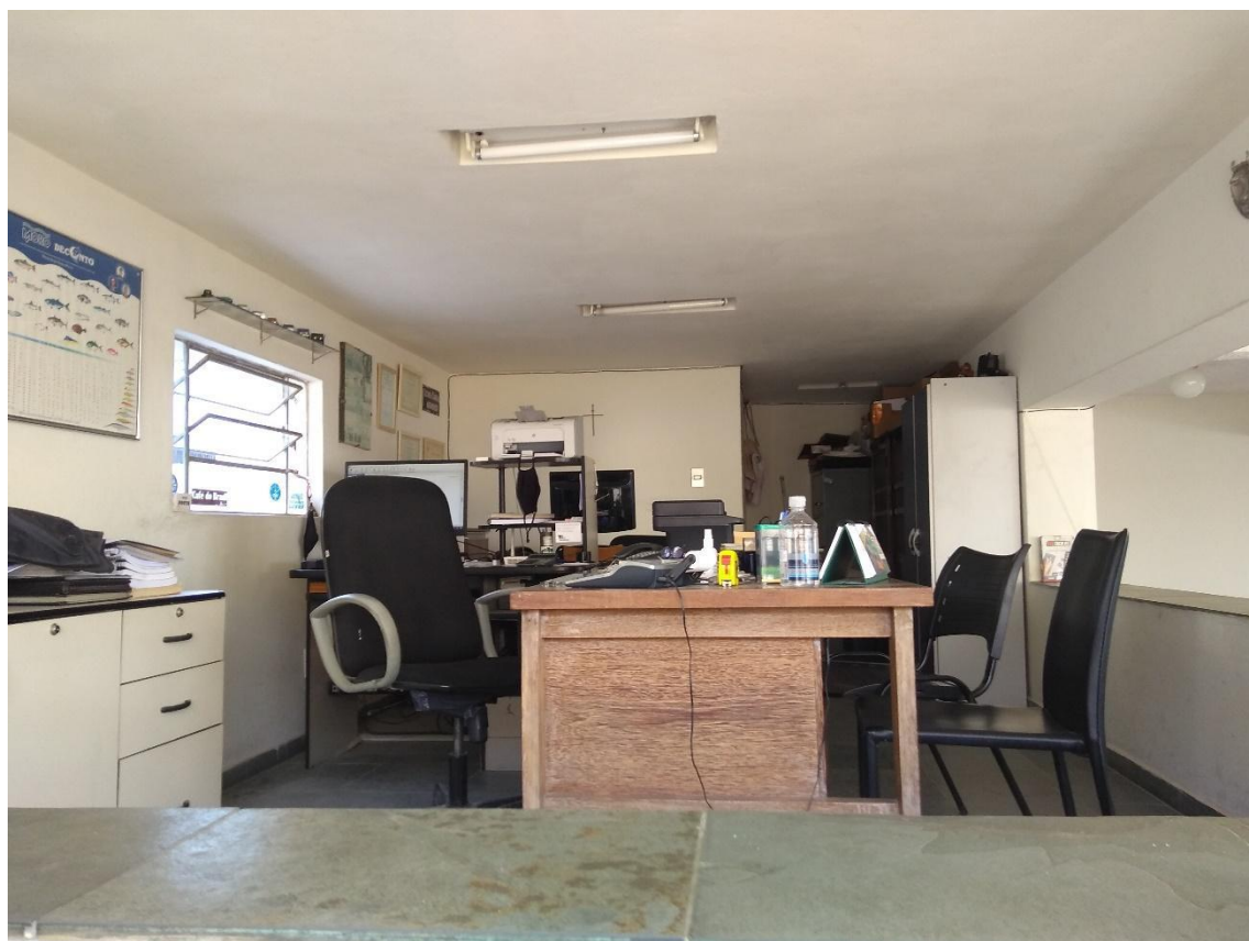
Figura 3 – Escritório da Agropecuária Toledo Pena