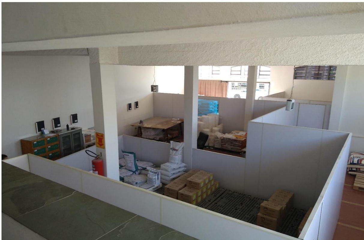
Figura 2 - Área interna da Agropecuária Toledo Pena