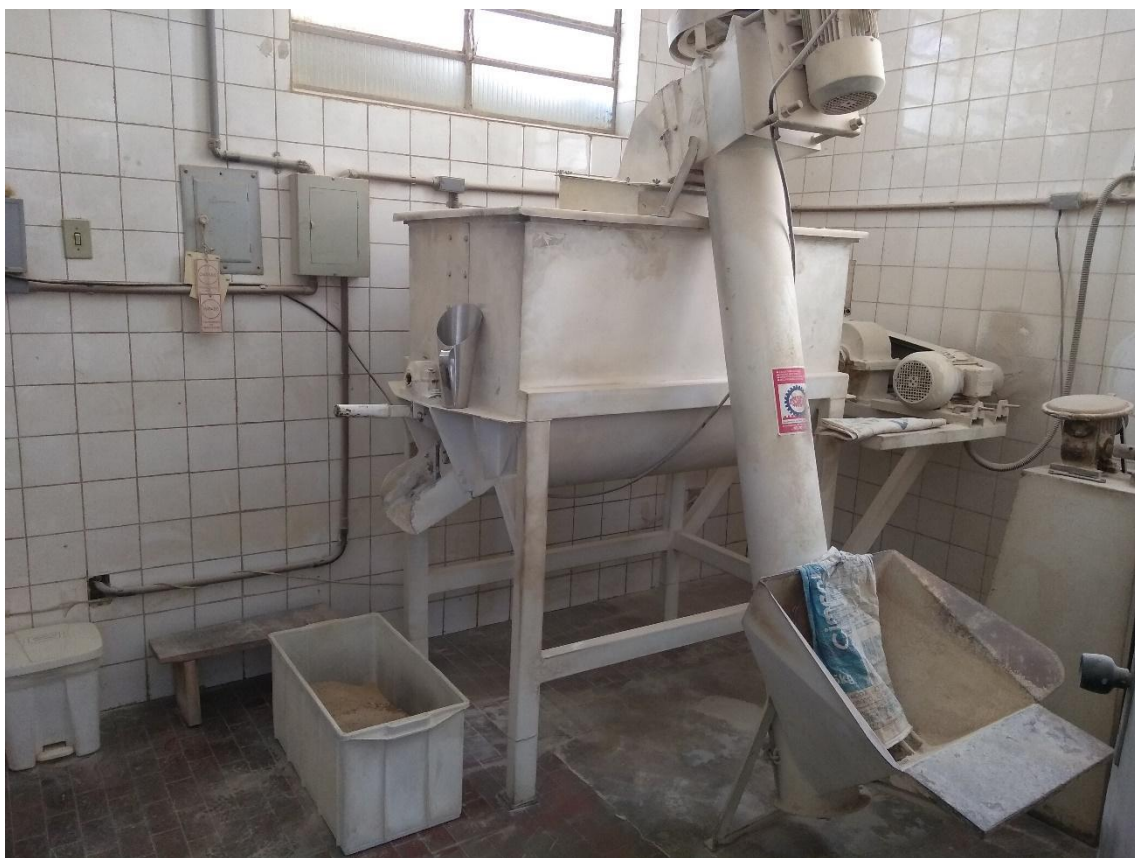
Figura 4 – Macro Misturador