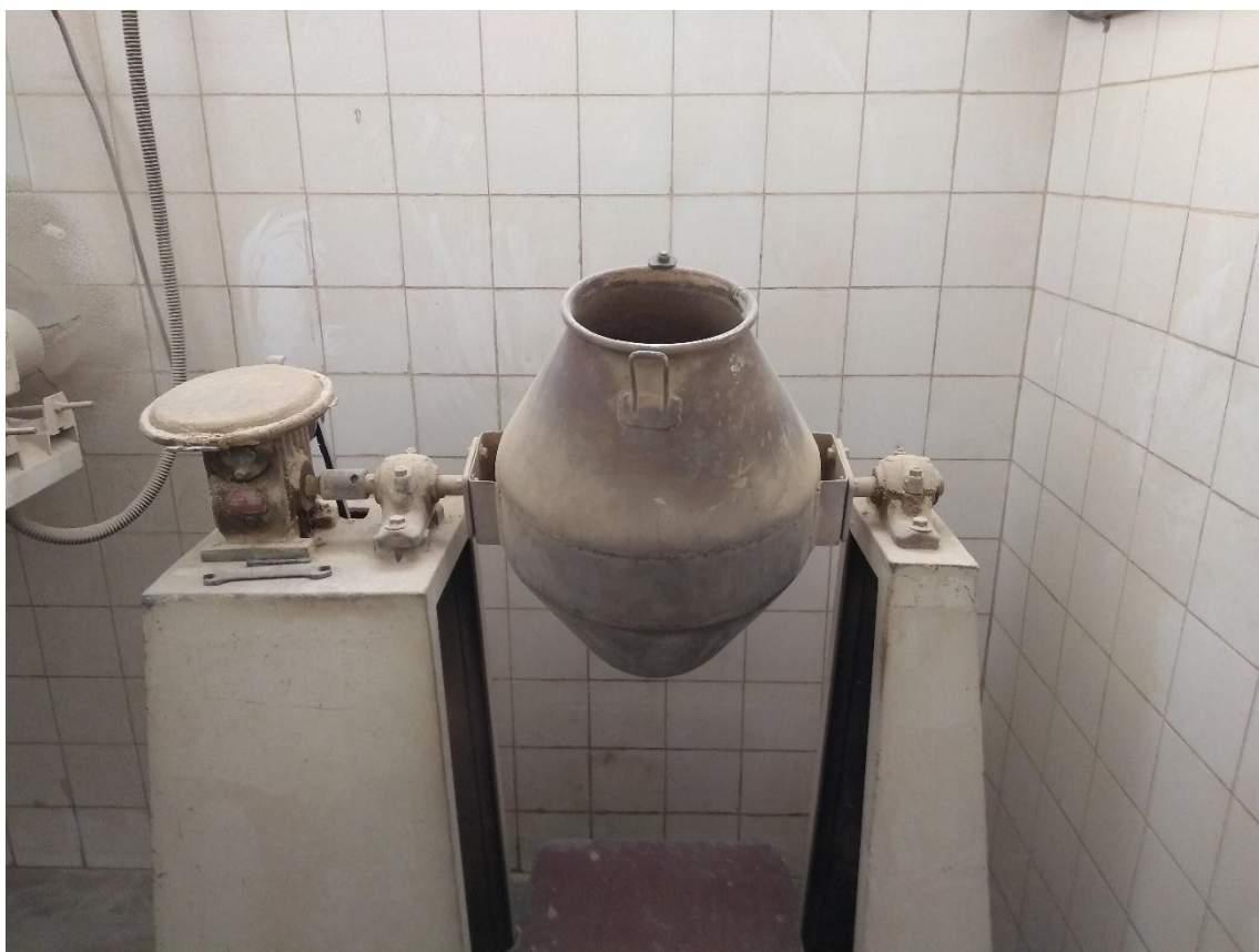
Figura 5 – Micro Misturador