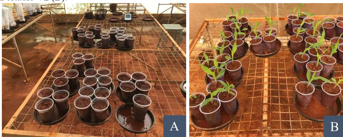
Figura 2: Cultivo das plantas em casa de vegetação. Semeadura (A); Plântulas de milho em estágio V2 (B).