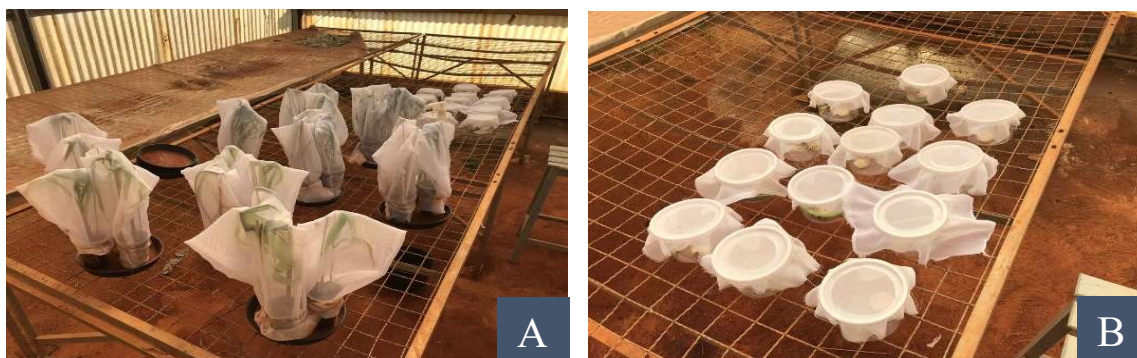
Figura 3: Experimento em casa de vegetação. A) Plantas de milho e trigo (B) e tratamento controle

A sementeira do milho e trigo foi realizada em recipientes de 400 ml preenchidos com terra e esterco na proporção de 3:1. Para o confinamento dos insetos utilizou-se um