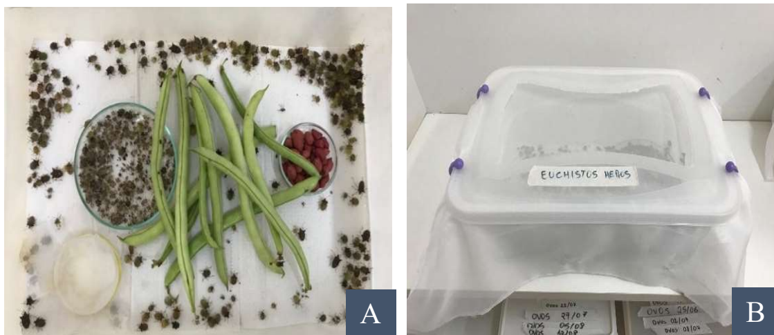
Figura 1: Interior (A) e exterior (B) da gaiola de criação de Euschistus heros

Para a montagem do bioensaio, durante 7 dias foram coletadas todas as posturas da caixa de criação, a fim de iniciar um novo ciclo e obter insetos com idade conhecida. Essas posturas foram colocadas em placas de Petri de (150 x 15mm), com algodão umedecido para manter a umidade e vedadas com papel filme até a eclosão das ninfas, as quais foram transferidas para uma caixa de criação utilizando os mesmos procedimentos descritos anteriormente até a emergência dos adultos.