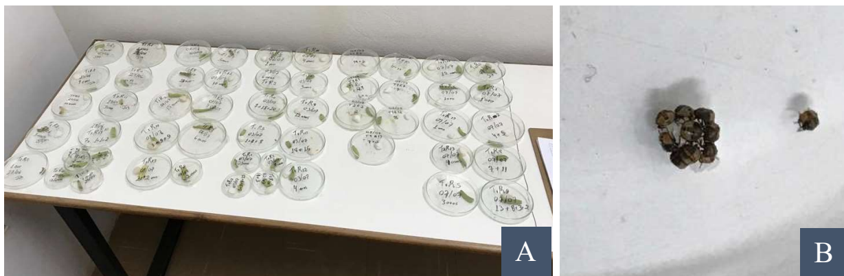
Figura 5: Posturas individualizadas em placas Petri e identificadas (A) ninfas eclodidas (B).

foi realizada com papel filme. A avaliação foi realizada diariamente, anotando-se a duração do período embrionário, e o número de ovos viáveis, sendo que as ninfas foram devolvidas a criação de manutenção do laboratório.