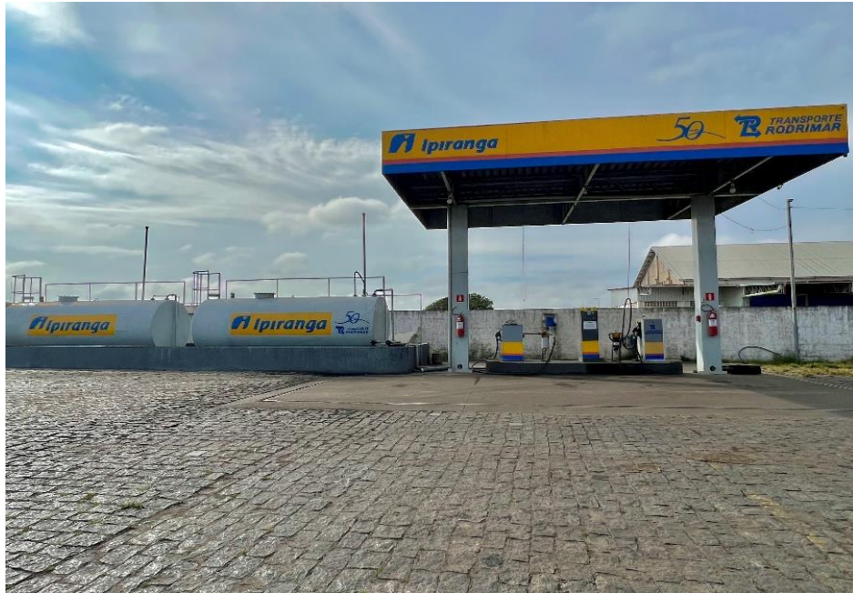
Figura 5 – Posto de Combustível da HBR Transportes