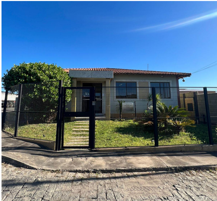
Figura 2 – Escritório da HBR Transportes

A Figura 2 apresenta a fachada do escritório da HBR Transportes. Seu interior possui os departamentos jurídico, logístico e contábil, sala de reuniões, recepção, salas dos diretores da HBR Transportes e da Rodrimar, e cozinha.