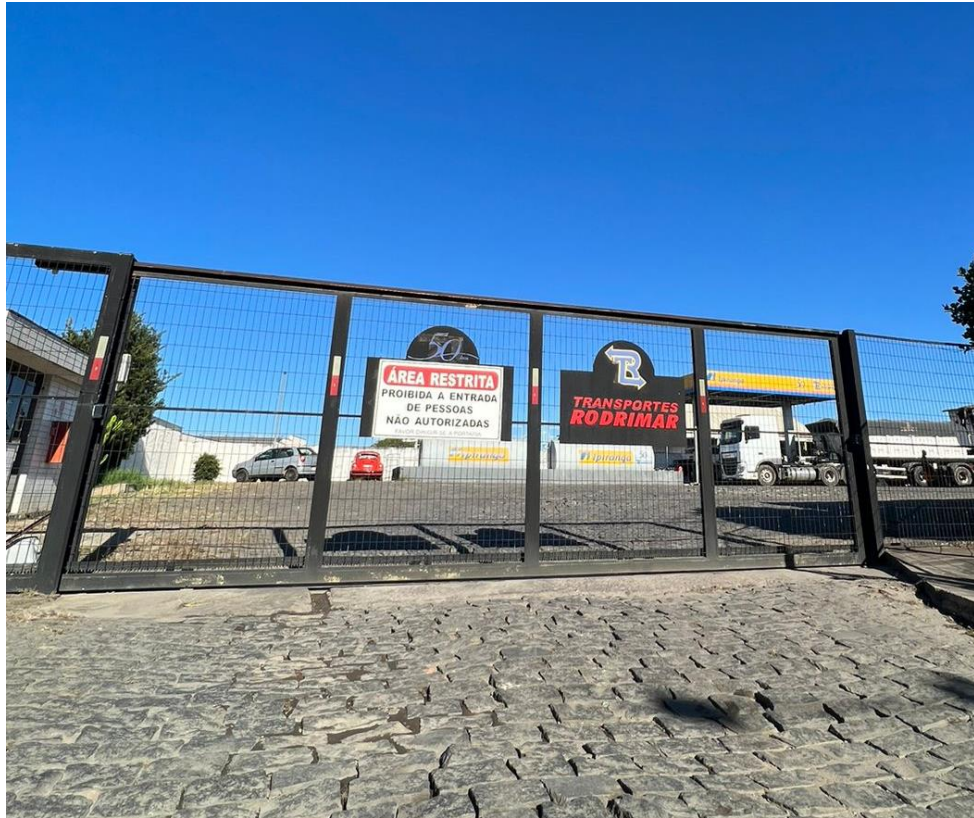
Figura 4 – Entrada do Estacionamento da HBR Transportes