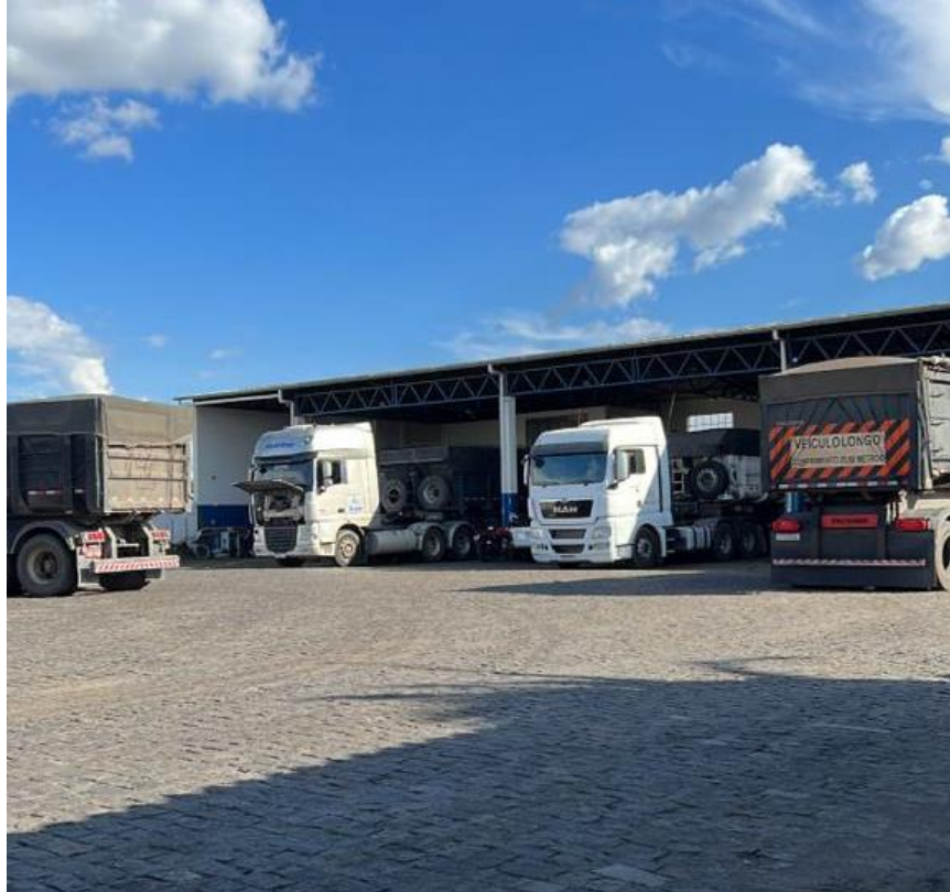
Figura 7 – Oficina da HBR Transportes

A figura 7 representa a oficina mecânica da HBR Transportes, local em que os caminhões são encaminhados após as viagens para eventuais manutenções e conferências para a próxima viagem.