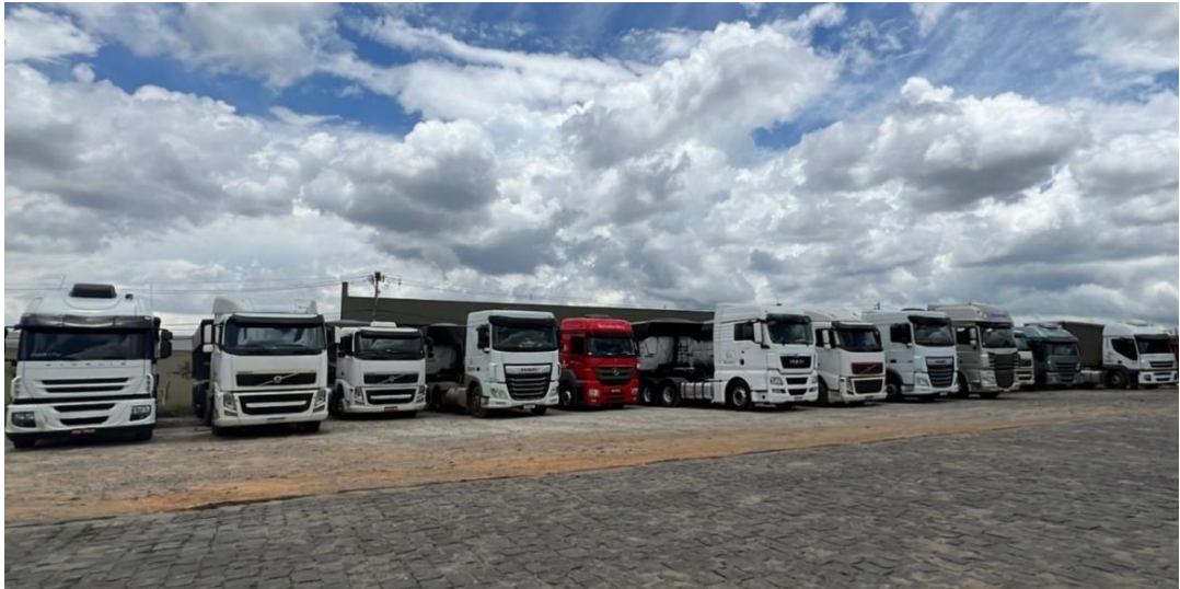
Figura 1 – Frota da HBR Transportes