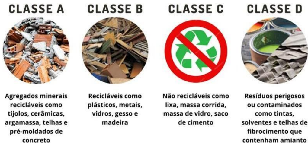
Figura 3 - Resíduos de Construção Civil são separados em Classe A, B, C ou D.

vidros, plásticos, tubulações, fiação elétrica etc., comumente chamados de entulhos de obras, calça ou metralha, como mostra a Figura 3.