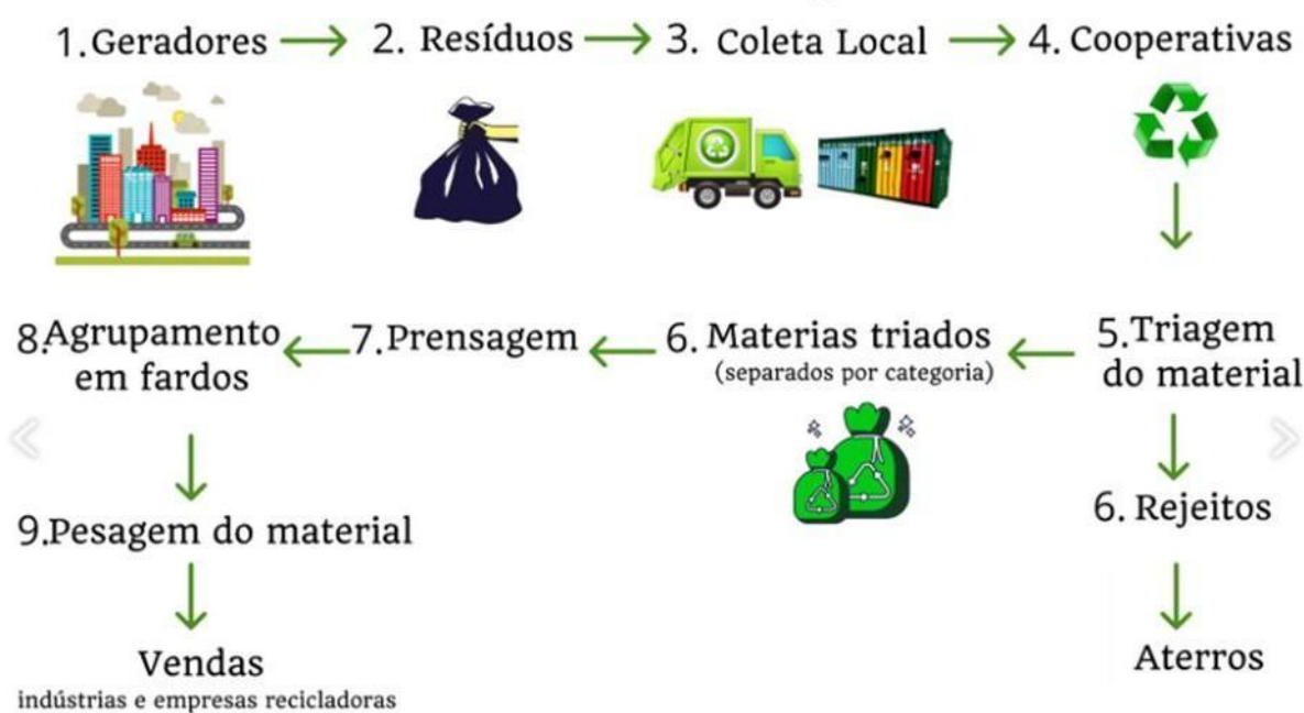
Figura 2 – Sistema ideal de coleta de recicláveis

Em mais de 95% dos casos em que existe reciclagem, são utilizados os resíduos como tijolos, metal, madeira, plástico e vidro que possuem algum valor de mercado. A utilização destes materiais obriga à sua triagem e separação, estando dependente do seu estado de conservação, embora a maioria deste material seja durável e por isso tenha um elevado potencial de reutilização. É, portanto, desejável ter padrões de qualidade para os materiais reciclados. As coletas podem inclusive serem realizadas por meio de cooperativas, como mostra a Figura 2.