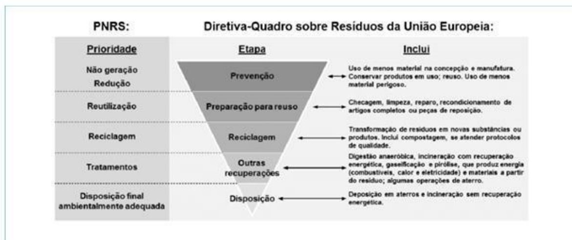
Figura 4 – Hierarquia de prioridade para o gerenciamento de resíduos sólidos

Observa-se que a prioridade dessa hierarquia é a não geração de resíduos. Seguindo da preparação para reuso, reciclagem e tratamento. Apenas resíduos em que não seja possível ações de reuso ou reciclagem, ou ações como digestão aeróbica, incineração para geração de energia entre outros, opta-se pela disposição em aterros ou incineração (PALERNO; BRANCO FREITAS, 2018), de acordo com a Figura 4, que mostra a hierarquia de prioridade para o gerenciamento de resíduos sólidos, segundo a Diretiva-Quadro sobre Resíduos da União Europeia, comparada com a hierarquia estabelecida na Política Nacional de Resíduos Sólidos (PNRS).