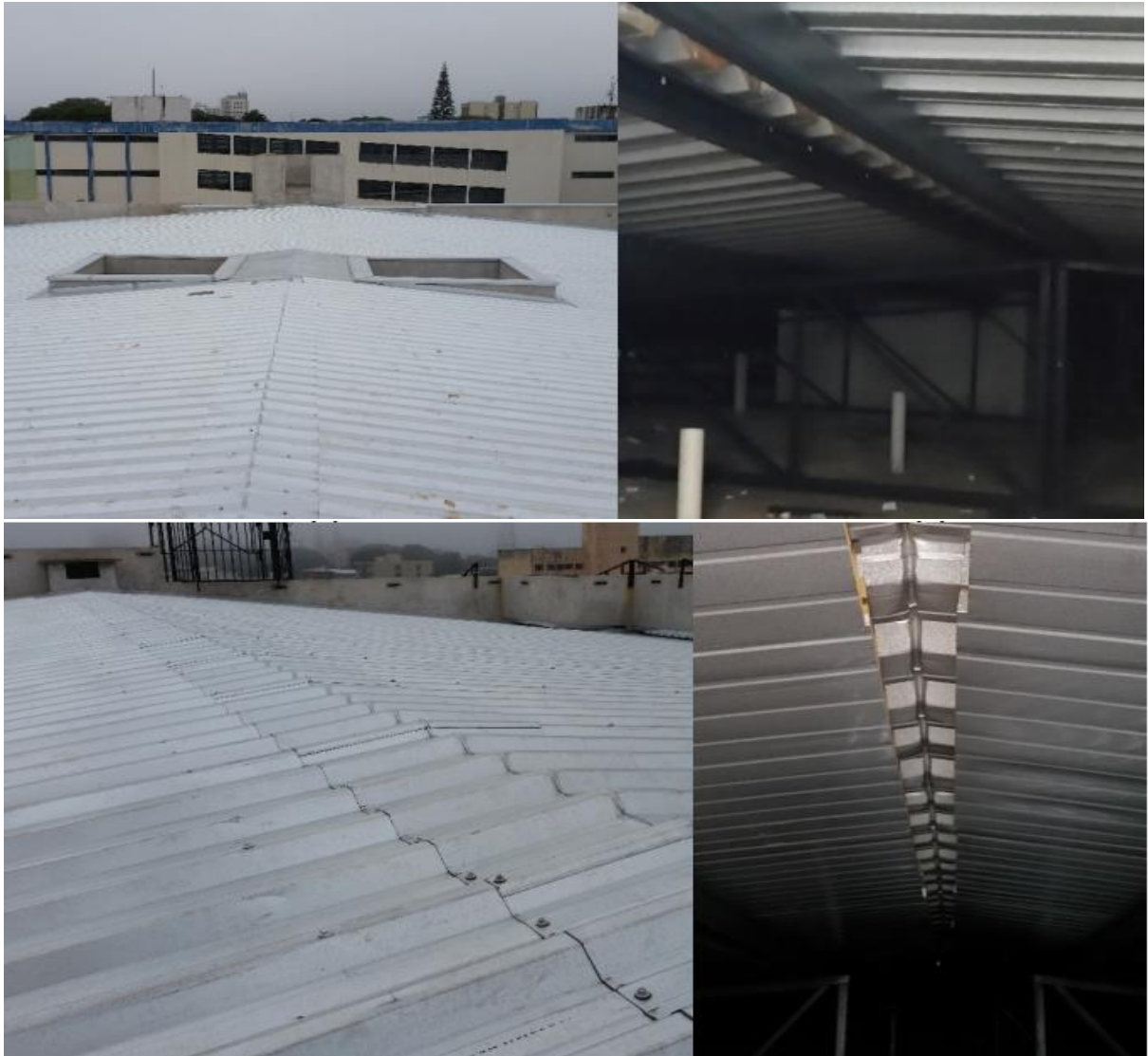
Figura 2 - Análise do fluxo de calor de um mesmo modelo de telha termoacústica, TP-40, com núcleos isolantes diferentes, uma com EPS e a outra com PIR, que revestiam a cobertura de dois edifícios na cidade de Campo Mourão-PR.