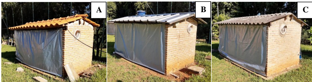
Figura 1 – Protótipos com telhas cerâmica (A), termoacústica (B) e de fibrocimento (C).

Silva (2021) visando comparar o uso de três tipos de coberturas (Figura 1), sendo elas: telha cerâmica (A), telha termoacústica (B) e telha de fibrocimento (C), por meio de sensores colocados dentro dos protótipos, avaliou os seguintes índices: ITU, ITGU, CTR, TRM e TE. Constatou-se que o uso da telha termoacústica se mostrou a segunda melhor escolha, uma vez que a cobertura cerâmica trouxe as melhores condições ao ambiente, porém deve-se levar em conta a inclinação irregular do telhado cerâmico utilizado no experimento.