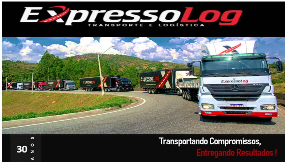
Figura 1 – Identidade visual da Expresso Log Transportes e Logística.