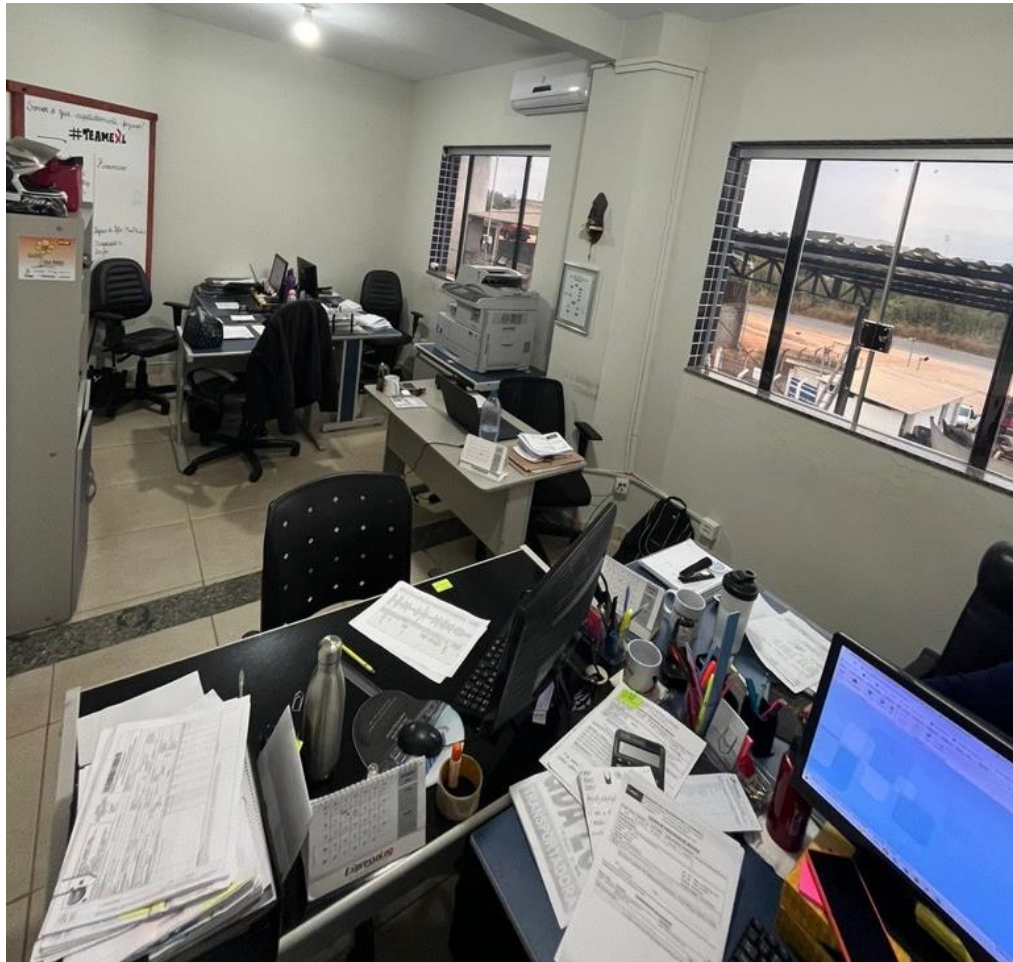
Figura 7 – Fotografia da recepção da Expresso Log Transporte e Logística.