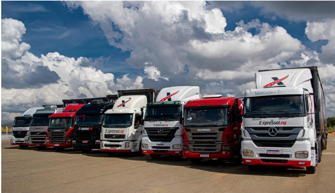
Figura 2 – Frota de veículos da Expresso Log Transportes e Logística.

Recrutamento & Seleção e Gerenciamento de Risco. As Figuras 2 e 3 demonstram alguns modelos de veículos que fazem parte de sua frota.