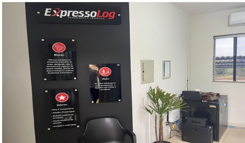
Figura 6 – Fotografia da recepção da Expresso Log Transporte e Logística.

A recepção da empresa matriz localizada em Lavras está representada na Figura 6.