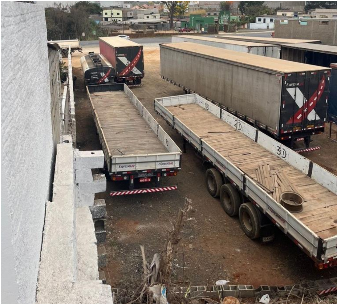
Figura 8 – Fotografia do pátio da Expresso Log Transporte e Logística