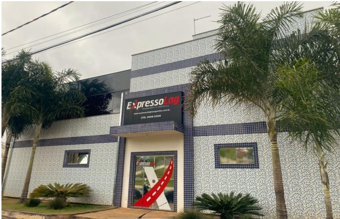
Figura 5 – Fotografia da fachada da Expresso Log Transporte e Logística.