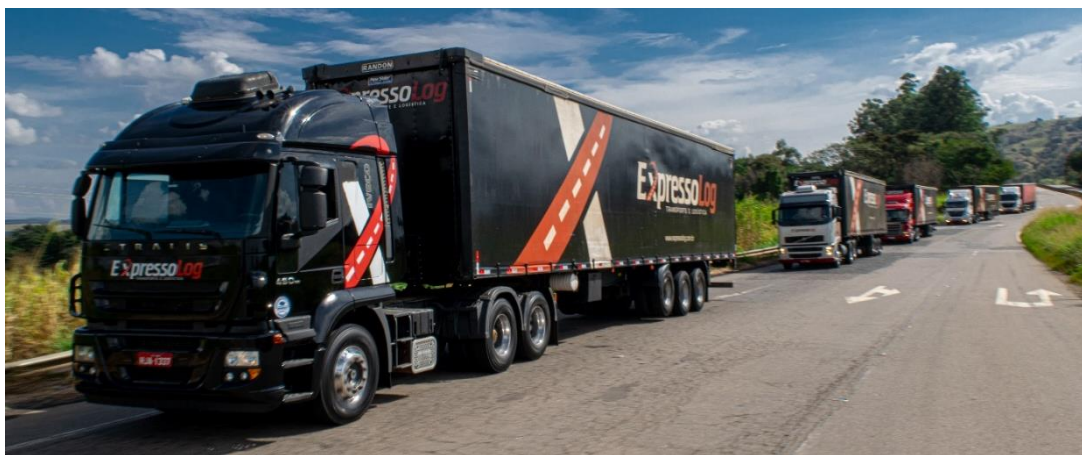
Figura 3- Frota de veículos da Expresso Log Transportes e Logística.