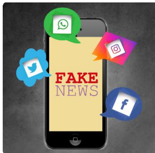
Figura 2: Fake news e celular

No segundo encontro abordaremos as Fake News. (Disponibilização do texto “O que são Fake News ” – Anexo B).