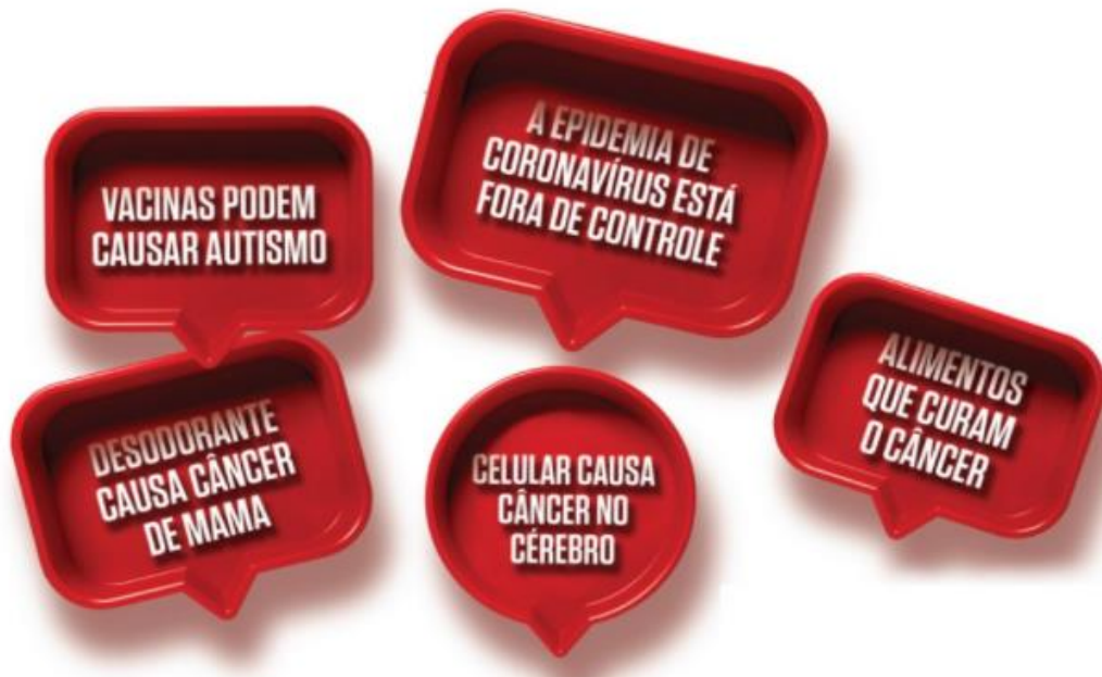
Figura 3: Impacto das Fake News na saúde