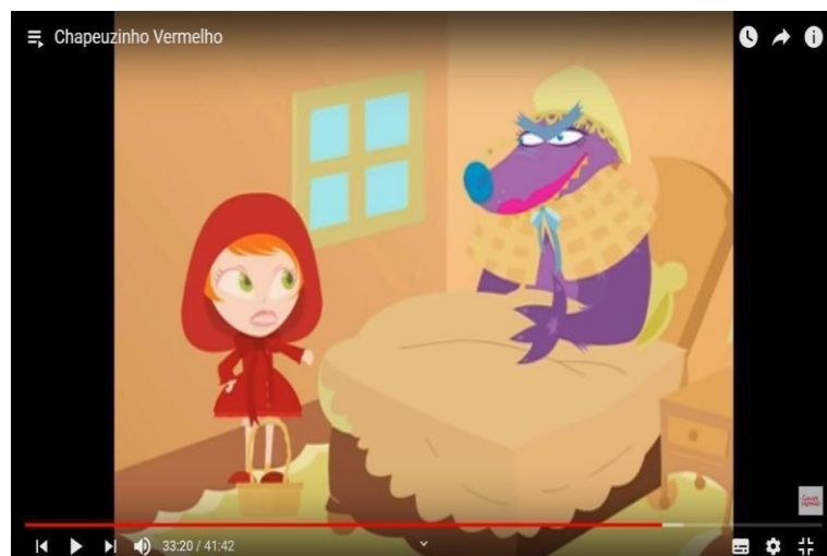
Figura 1 – Print da tela da história “ chapeuzinho vermelho”