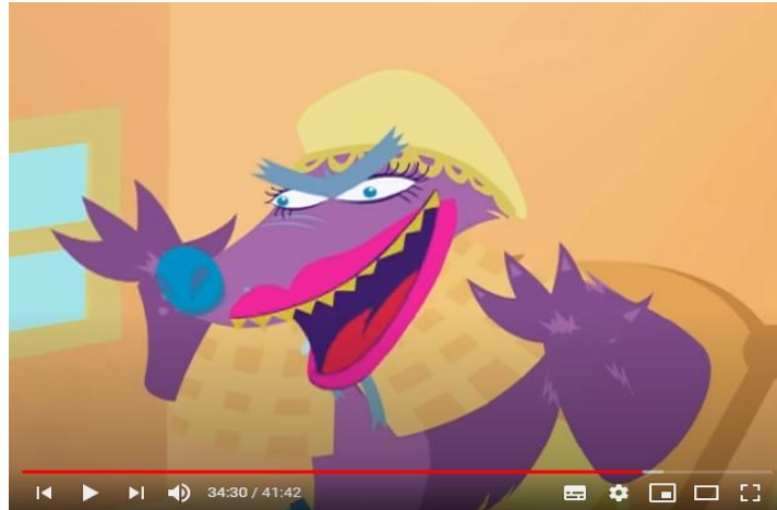
Figura 2 – Print da tela da história “ chapeuzinho vermelho”

possibilidades de mover/movimento/movência que o livro proporciona a cada um de seus leitores.