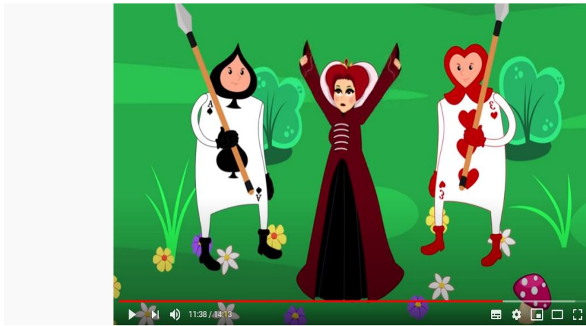
Figura 4 – Print da tela da história “ Alice no país das maravilhas”