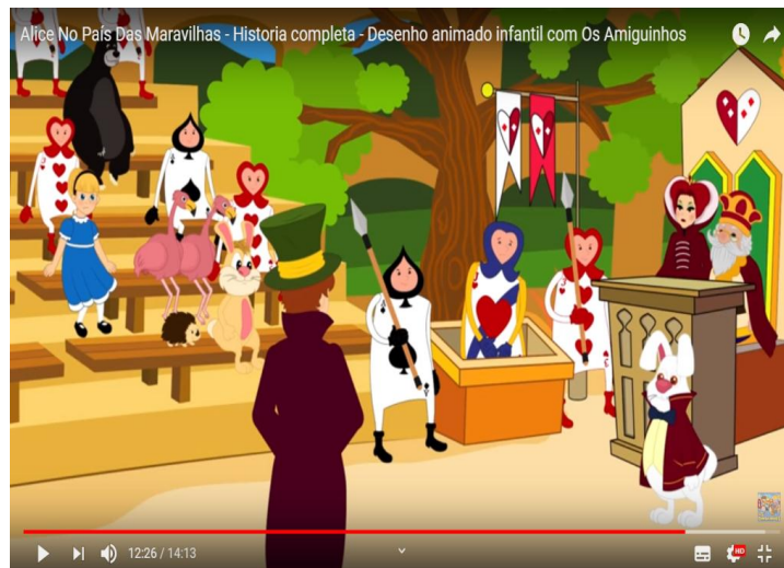
Figura 3 – Print da tela da história “Alice no país das maravilhas”